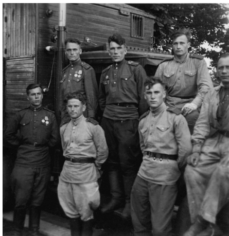
Skupina vojáků u svého radiovozu