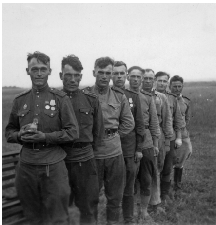
Skupina vojáků na zahradě u Havláskových