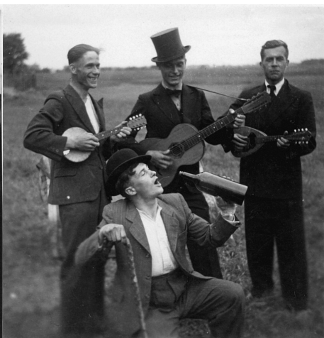
Vojáci pózují v civilu a s hudebními nástroji