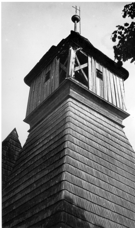
Prostřelená věž kostela

tu měl hodinář právě ve správce. Jiná, ještě hroznější věc. Celý dvůr v Hrabové byl vyrabován. Krávy, asi 55 kusů zabito, vepřový dobytek všechen zničen, byt vykraden ..., že prý p. statkář je „Germán“. Pachatel, který ruským vojákům lhal na p. statkáře, byl odměněn. Stal se velkým pánem, odešel do pohraničí. Ruští vojáci zůstali v Hrabové až do července. Hrabovské školy obě obsazeny vojskem, proto se nevyučovalo vůbec. Je to jediná škola na celém Ostravsku, kde se nemohlo učit.