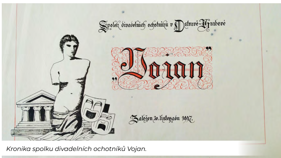
Kronika spolku divadelních ochotníků Vojan.