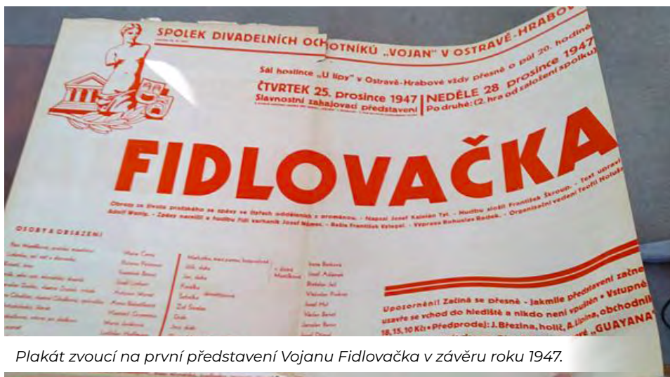
Plakát zvoucí na první představení Vojanu Fidlovačka v závěru roku 1947.