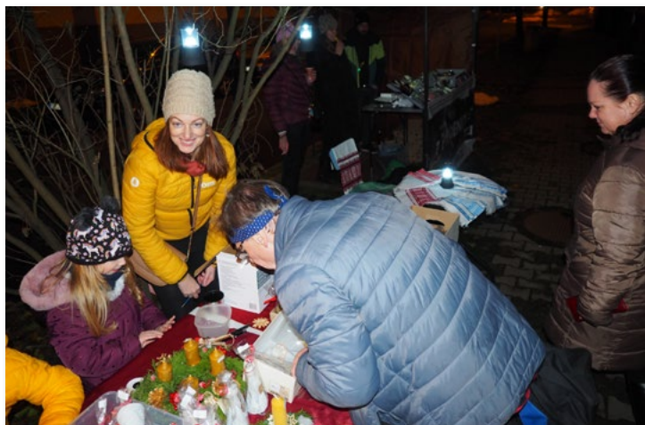
15. 12. Letos poprvé se konal na ul. Viktora Huga "Jarmark v ulici".