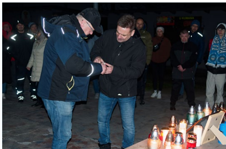
22. 12. Již tradičně uspořádali bývalí i aktivní členové Sokola na hřišti pietní vzpomínku za kamarádky a kamarády, kteří již nejsou mezi námi.