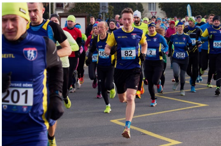
31. 12. Silvestrovský běh měl dva okruhy, kratší "Lidový běh" měřil 4,7 km a delší "Hlavní závod" 9,2 km. Do cíle doběhlo 250 závodníků.