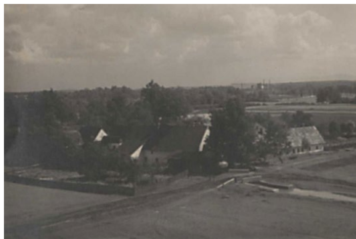
Fotografie hrabovského mlýna, 20. léta 20. století