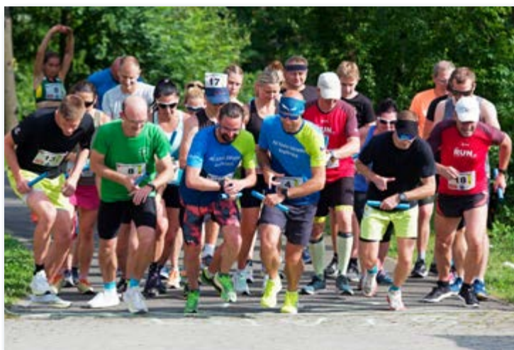
26. 6. Na startu třetího kola běžeckého seriálu Štafetová míle – O pohár obce Hrabová.