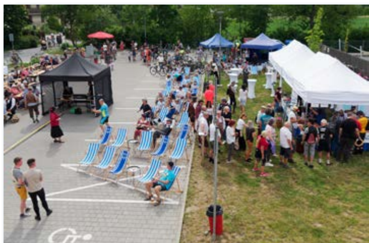
30. 5. Pro účastníky celosvětového setkání historických kol IVCA Rally 2024 bylo u kulturního domu připraveno občerstvení s hudebním programem, lehátkovou relaxační zónou, dřevěným dobovým kolotočem a soutěžími nejen pro děti