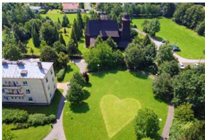
28. 6. V parku před úřadem se tento měsíc již podruhé objevilo tradiční zelené srdce. Děkujeme panu Ivo Baronovi.