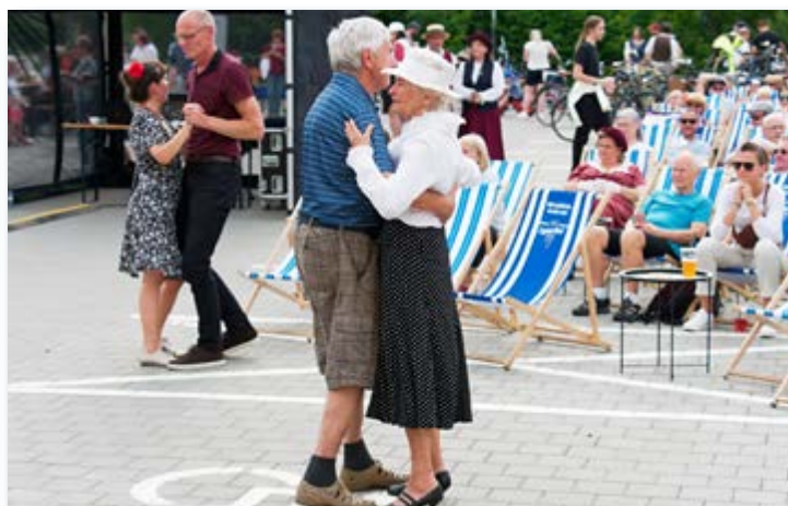
30. 5. Přehlídka velocipedů, dobového oblečení, tanec nebo poslech hudby byly skvělým zážitkem, kterým jsme si mohli zpříjemnit čtvrtěční odpoledne.