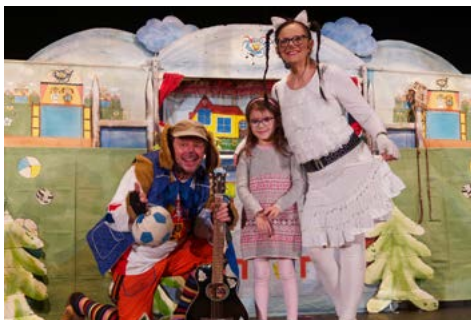
Pohádka Pejsek a kočička jdou do divadla