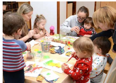
Tvůrčí dílnička v klubu Šidélko