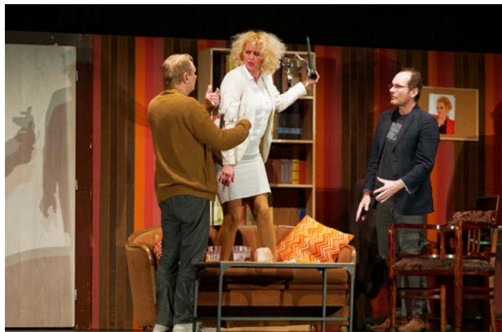
Divadelní představení Fantastická žena

Také o hudbu nebyla nouze. S příjemným recitálem vystoupil legendární písničkář Jiří Dědeček, jehož krásný dvouhodinový koncert s vtipným vyprávěním pohladil po duši nejednoho posluchače. Oblibě se těší i pravidelná středeční Taneční kavárna, kterou navštěvují taneční nadšenci každého věku.