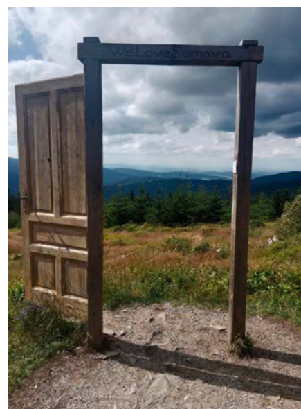
Zuzana Skotnicová / Dveře do neznáma