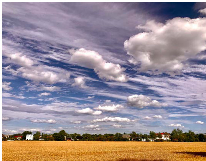
Květoslava Nyklová / Letní Hrabová