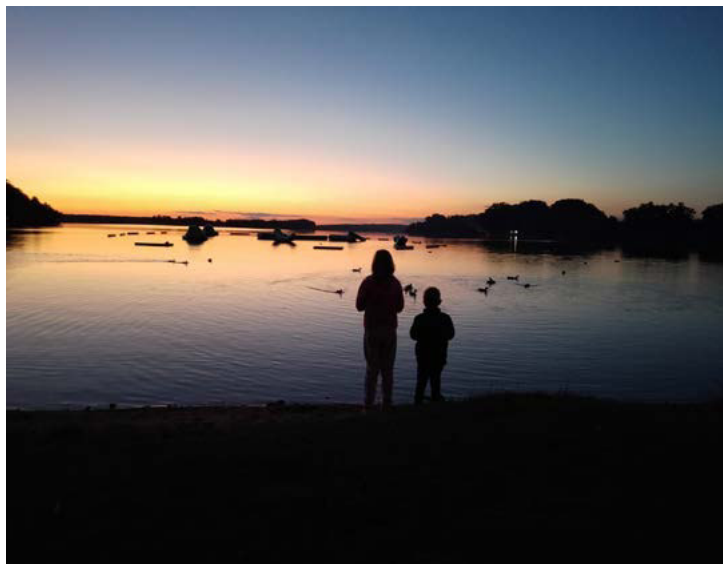
Klára Nováčková / Krmení kachen v kempu u rybníka Bezdrev