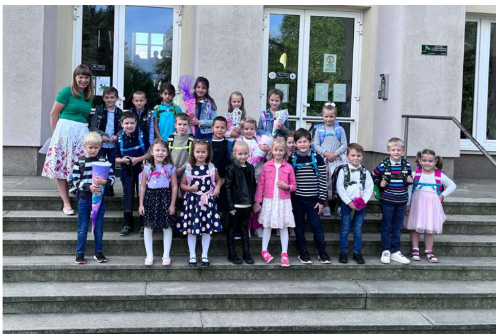
Žáci 1. A