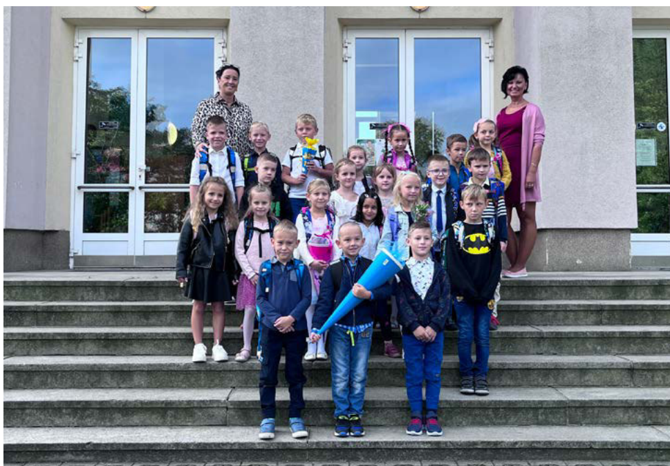
Žáci 1. B