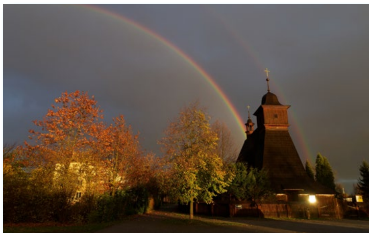
15. 11. Krátký listopadový déšť společně s podzimním sluncem utvořily na obloze duhu. Začínala nad kostelíkem.