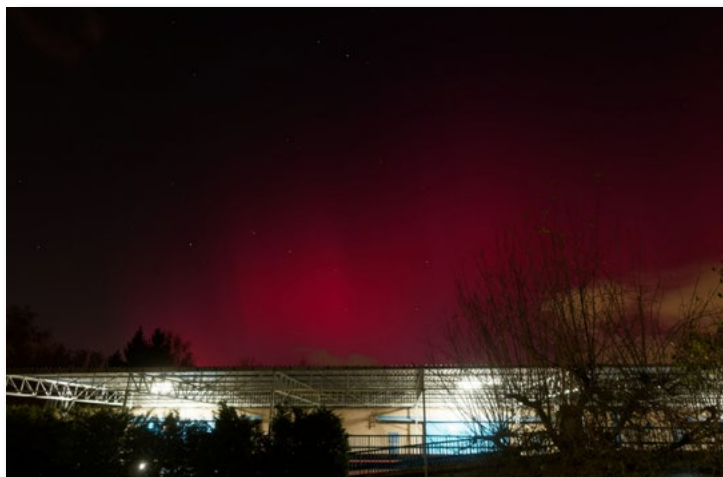
5. 11. Poprvé jsme viděli nad Hrabovou výraznou rudou polární záři.

Měsíc listopad nám připravil několik překvapení. Příroda se připravuje na dlouhé zimní období klidu a odpočinku, z nádherně podzimně zbarvených stromů postupně opadávají poslední listy, klesají teploty a zkracuje se den. Jedním z nejúchvatnějších úkazů tohoto měsíce byla výjimečná magická polární záře.