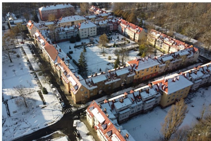
29. 11. Šídlovec v bílém hávu.