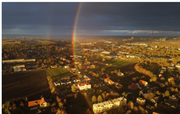
15. 11. Druhý konec duhy byl nad úřadem. Nádherný světelný úkaz, který trval jen pár chvil.