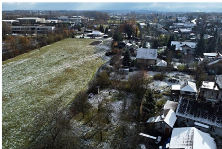
25. 11. „Paní Zima“ o sobě dává již vědět. V sobotu ráno napadl první sněhový poprašek.