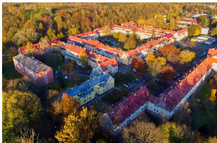
12. 11. Když podzim barví listí na Šídlovci.