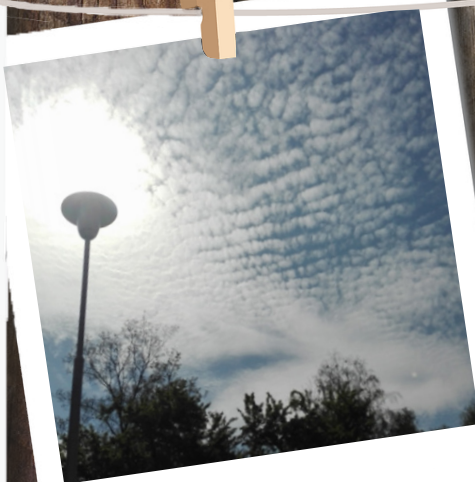
Beránci nad lampou