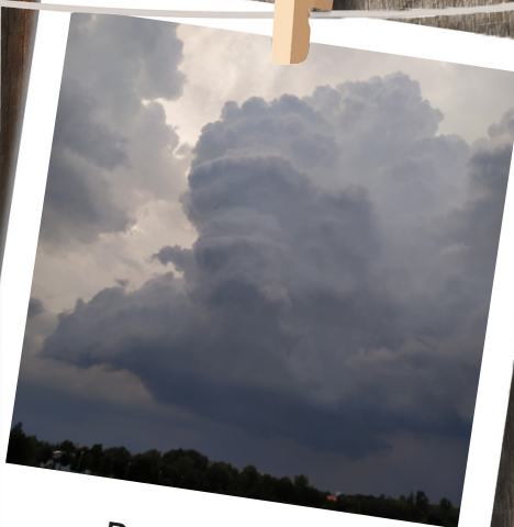
Bouřkový mrak - nebo mamut?