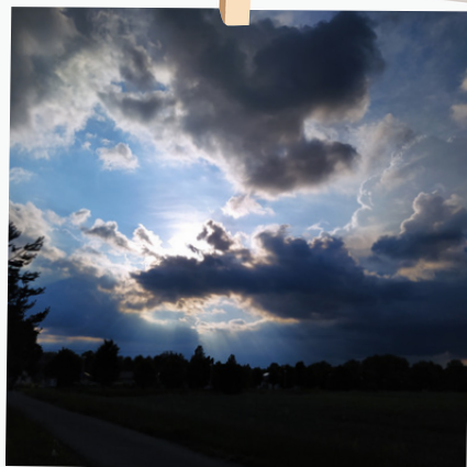
Sluníčko již ukryté za mrakem