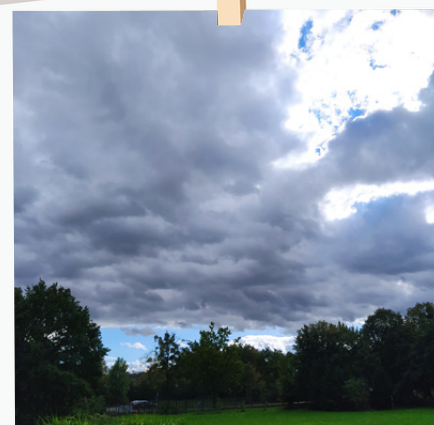
A za mračny již zase prosvítá modrá obloha