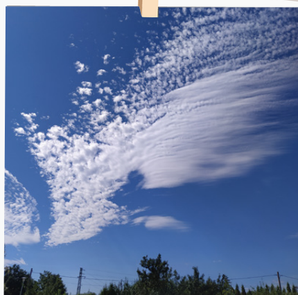
Křídlo ptáka nebo myška v bílém?