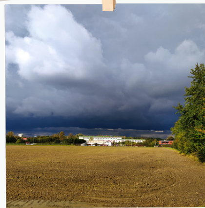
Slunce ještě svítí, ale v dálce již se blíží dešťové mračno