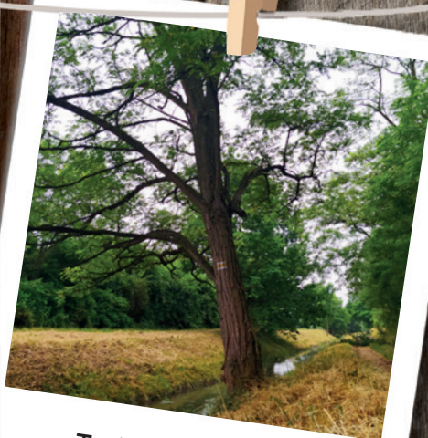
Turistická značka u odlehčovacího kanálu