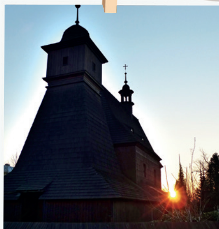
Východ slunce za kostelíkem