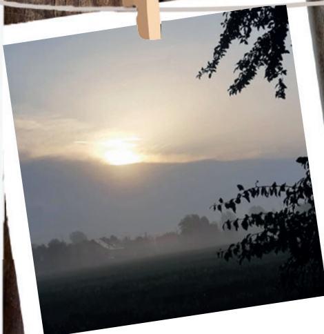
Slunce v mlžném oparu