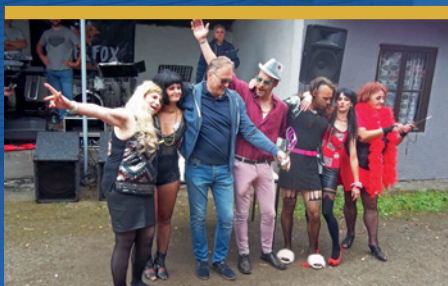
Gulášfest 2021 čtěte na str. 10