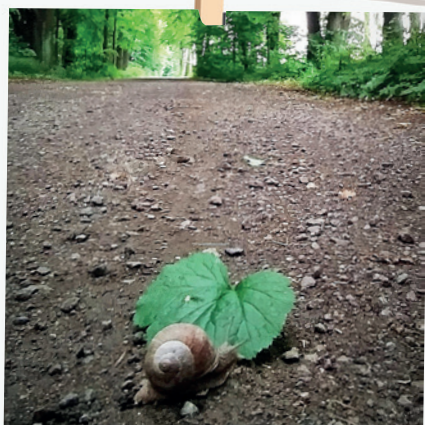
Šnek na vycházce k Pilíkům