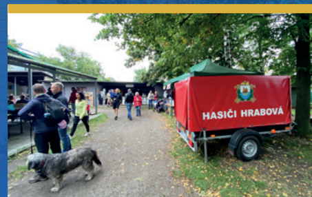
Den s hasiči čtěte na str. 12