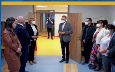
Slavnostní otevření nové mateřské školy čtěte na str. 5

Zpravodaj městského obvodu Ostrava-Hrabová