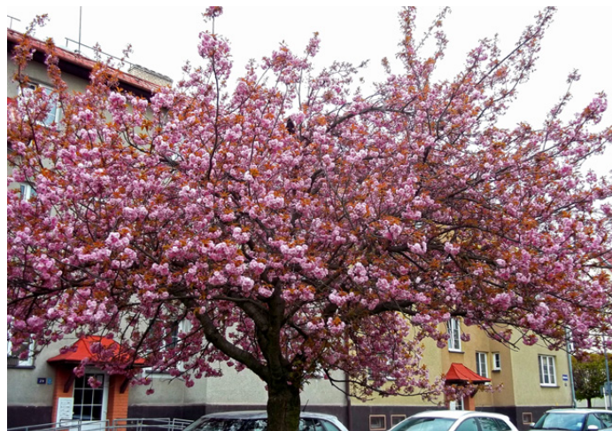
Text a foto: Jan Dvořák