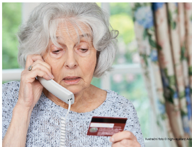
Ilustrační foto © highwaystarz Adob

Podvodníci vyhledávají seniory podle pevných linek a křestních jmen obvyklejších u starších lidí v on-line telefonním seznamu nebo v jiných dostupných zdrojích kontaktů (např. bazary, sociální sítě).