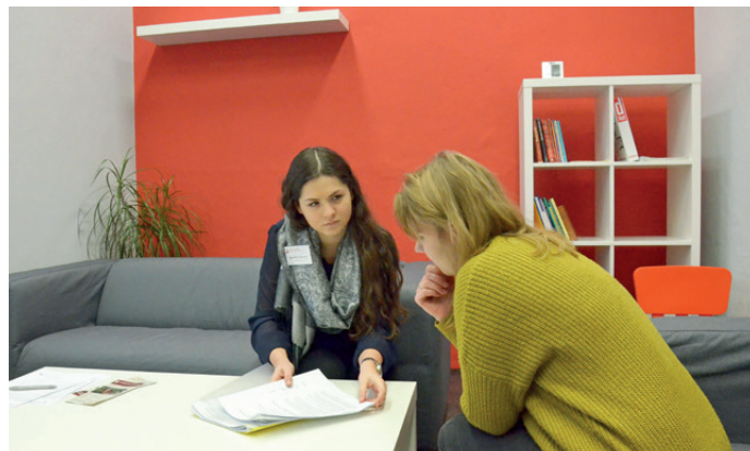
Text a foto: Dalibor Kraut

web: https://ostrava.caritas.cz/poradenske-sluzby/poradna-charity-ostrava .