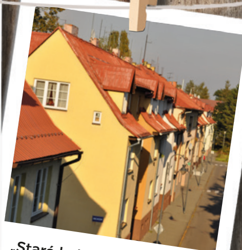
„Stará kolonka“ na Šídlovci