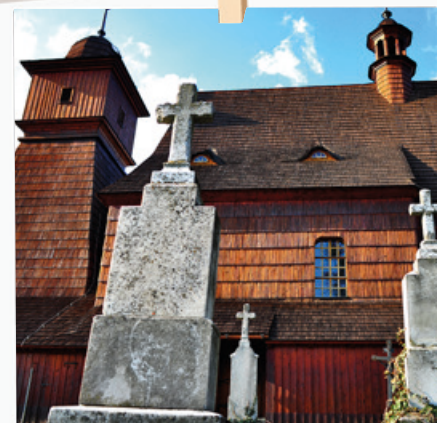
Pohled od starého hřbitova