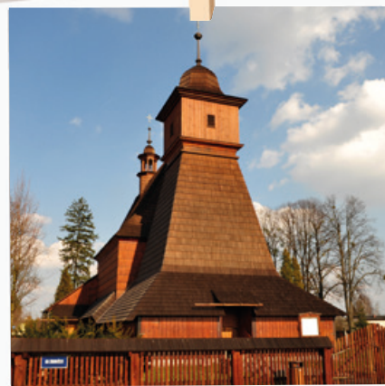
Honosný čelní pohled