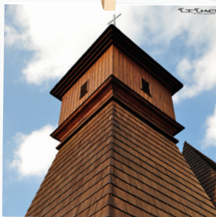
Věž našeho kostelíku