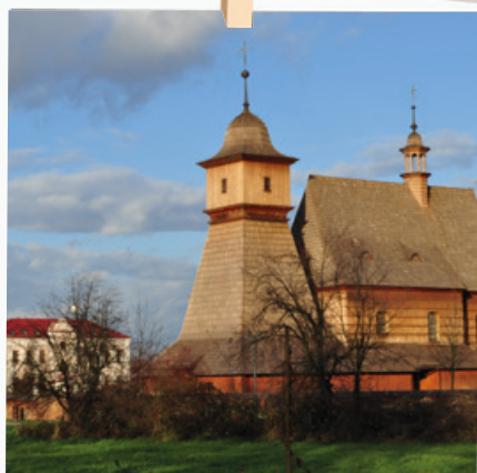
Novotou svítící kostelík v důstojné společnosti naší radnice