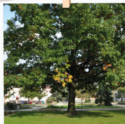
Krásný dub – dominanta parčíku na Šídlovci