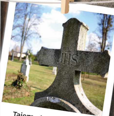
Tajemný starý hřbitov