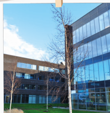
I v průmyslové zóně se nacházejí pěkná zákoutí