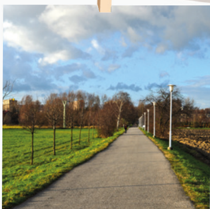
Domovská – hrabovské korzo