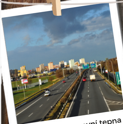
Míšecká – dopravní tepna procházející Hrabovou