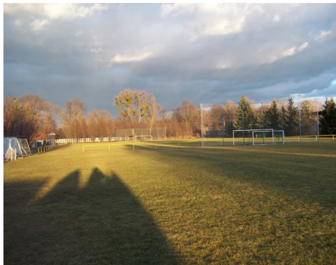
Text a foto nahoře: Daniel Nováček, Foto dole a foto upoutávky na titulní stránce: Jan Dvořák