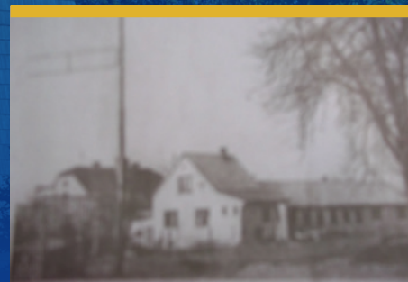
Fotbalové hřiště TJ Sokol má 70 let čtěte na str. 13