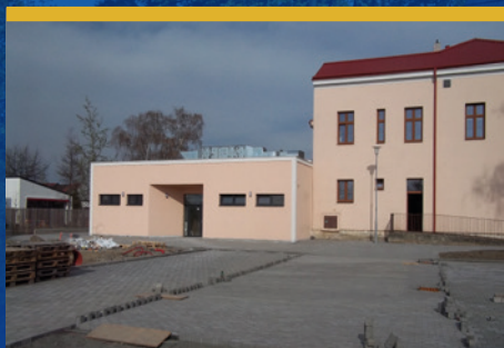
Kulturní sál je dokončený čtěte na str. 4

Zpravodaj městského obvodu Ostrava-Hrabová