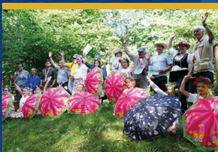
Hrabovské kosy čtěte na str. 9