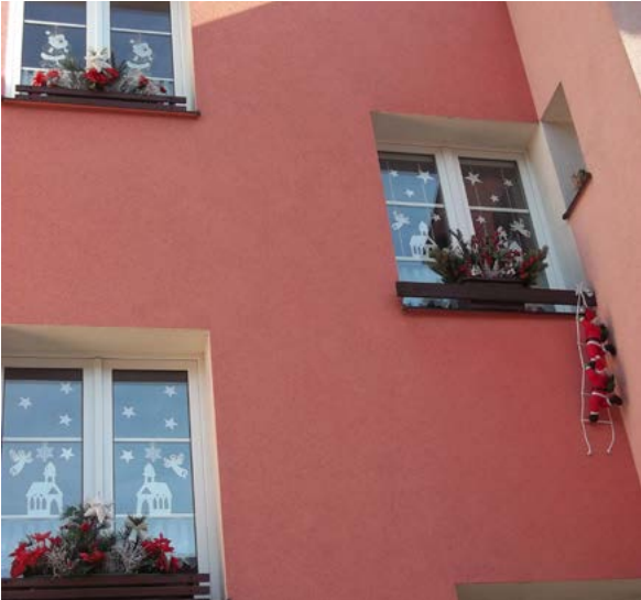
▲ Tak tohle je opravdu nádhera