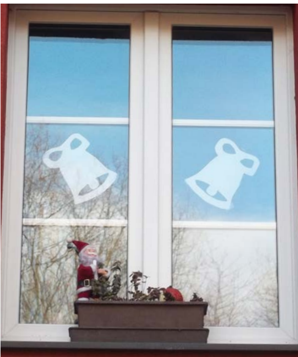
▲ A tady už je krásný Santa u okna