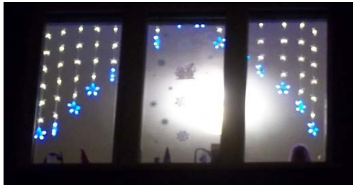
▲ I netradiční barvy mohou být hezké