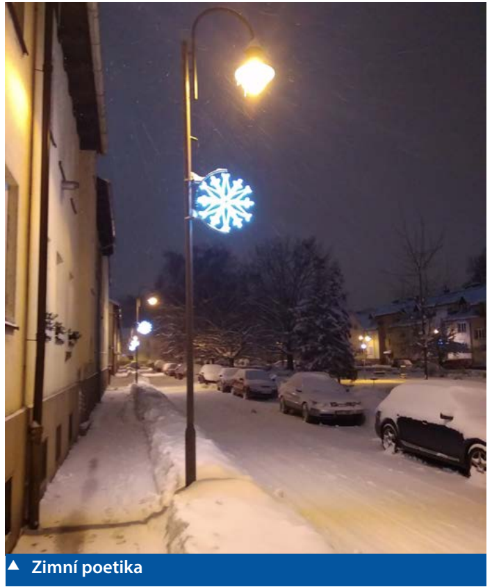
▲ Zimní poetika