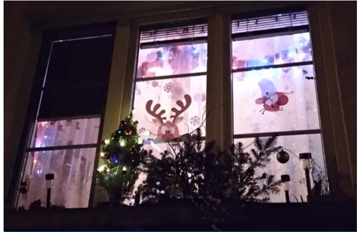
▲ Univerzálně krásná výzdoba ve dne i v noci