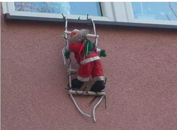
▲ Santa už leze!