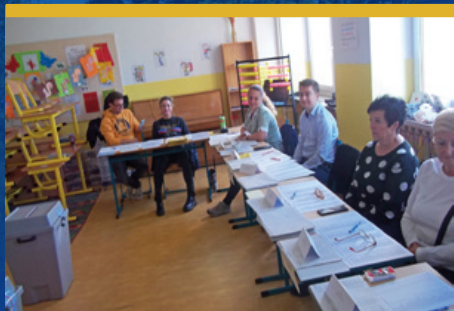
Výsledky komunálních voleb v Hrabové čtěte na str. 5

Zpravodaj městského obvodu Ostrava-Hrabová