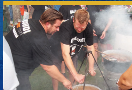
Gulášfest 2022 čtěte na str. 8