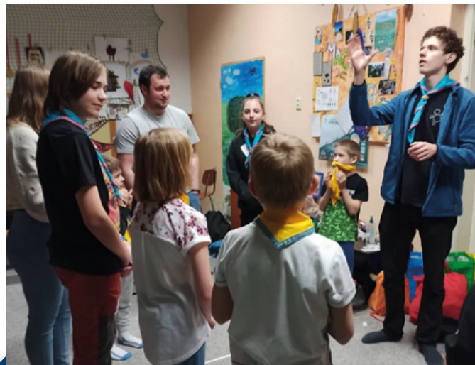
Hra v klubovně