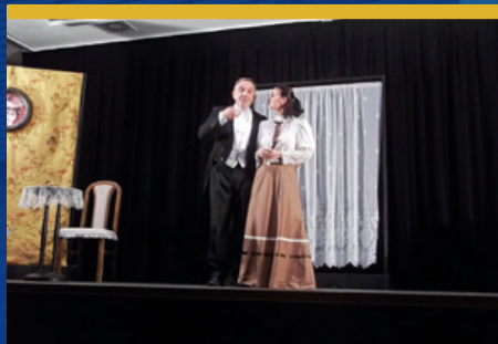
První divadelní představení v novém kulturním sále čtěte na str. 7