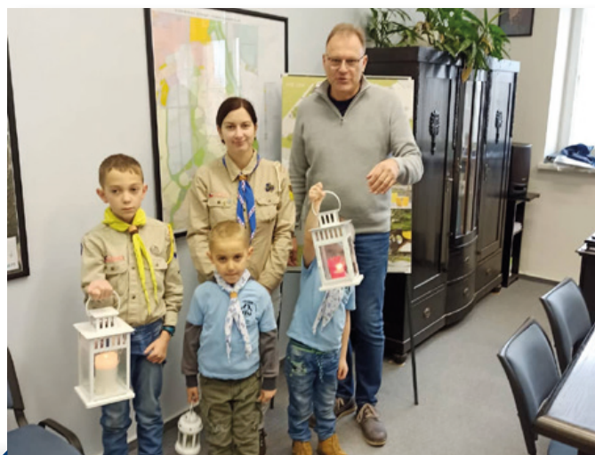
Roznos betlémského světla