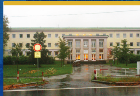
Zápis žáků do prvních tříd Základní školy Paskovská čtěte na str. 7