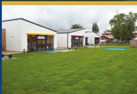
Zápis do Mateřské školy Klubíčko čtěte na str. 7