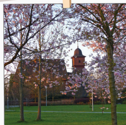
Májový pohled na kostelík