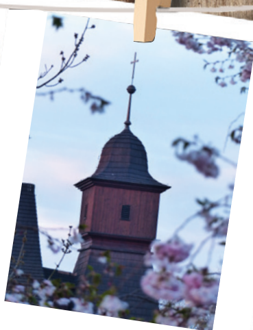
Věž kostelíku mezi květy