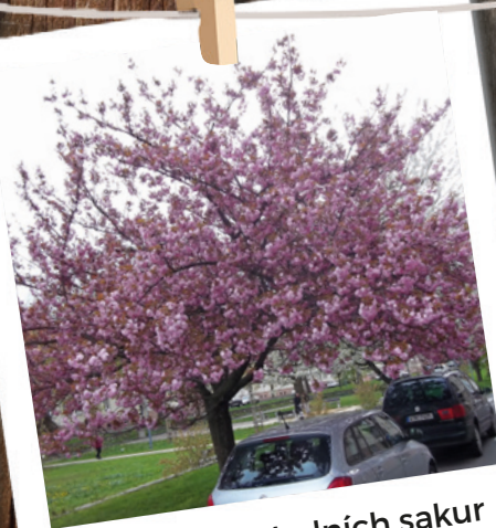
Jedna z posledních sakur původní aleje na Příborské