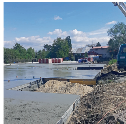
Stav 7. května 2020