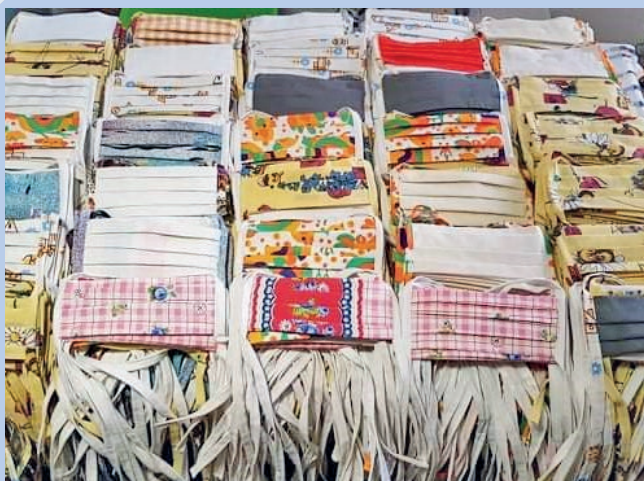
Výsledky práce našich švadlenek a jejich pomocníků