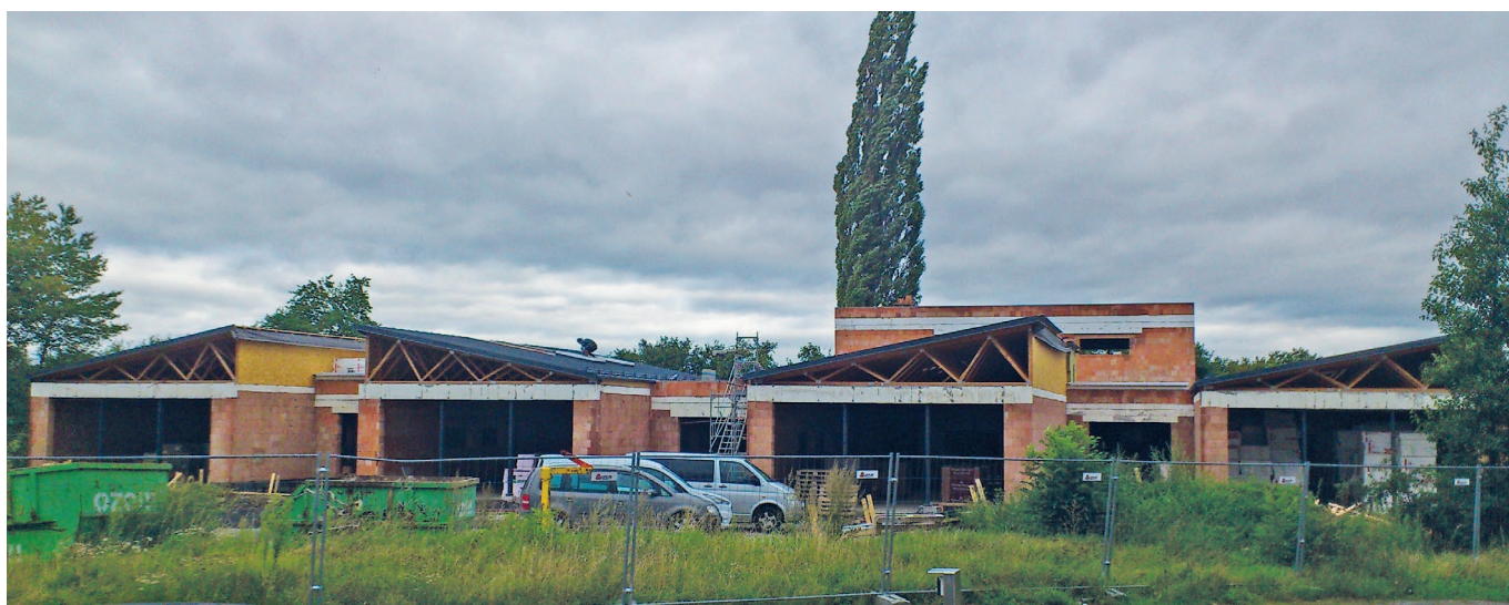
Stav 31. srpna 2020