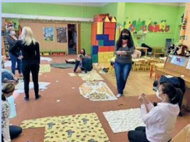
Stříhání látek v mateřské škole