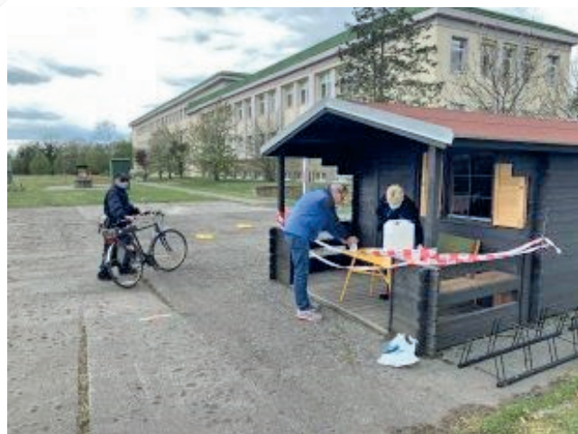
Distribuce dezinfekce na školním hřišti