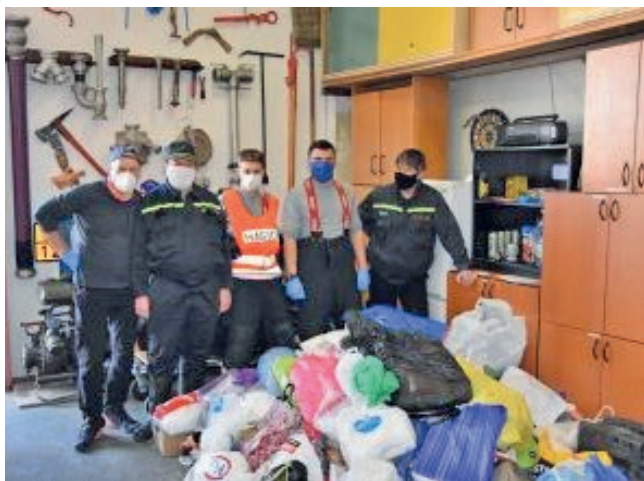
Členové Sboru dobrovolných hasičů nad vítězskem Láthové soboty