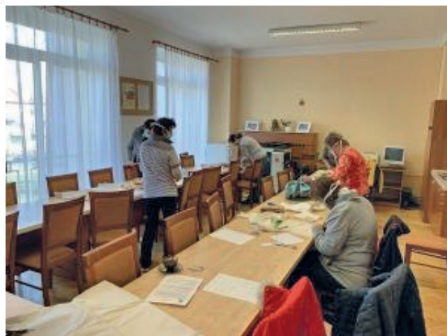
Základní škola v době koronavirové