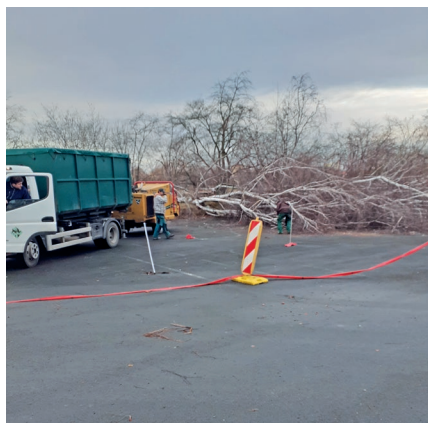
Stav 18. prosince 2019