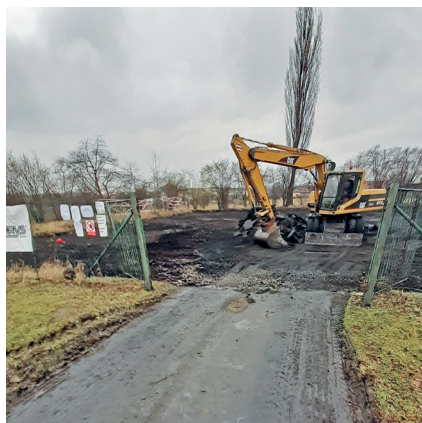
Stav 7. února 2020