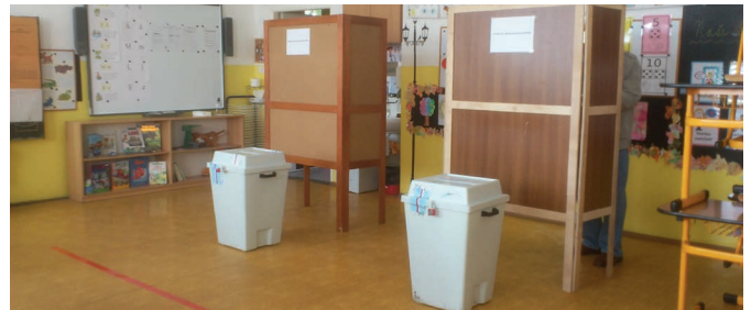
Výsledky voleb do Zastupitelstva Moravskoslezského kraje v Hrabové