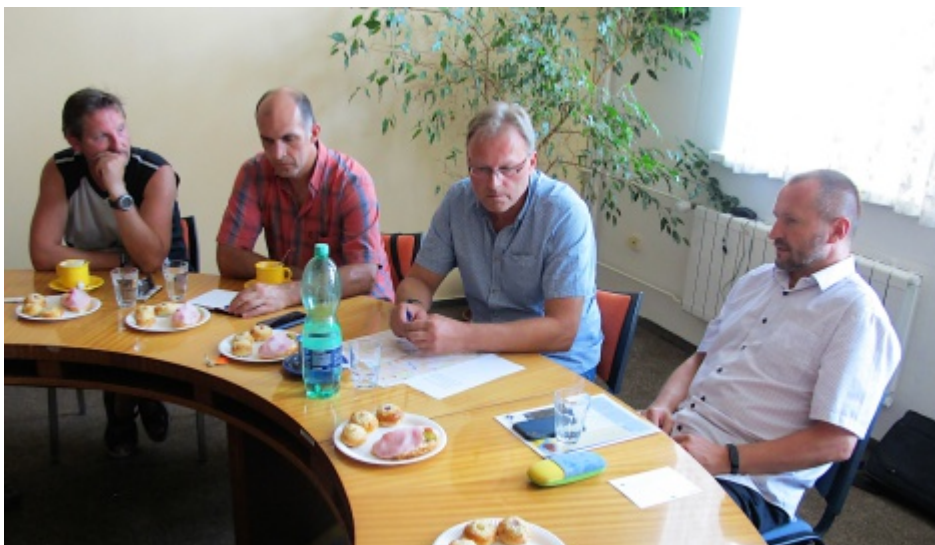
Z jednání zastupitelů s náměstkem hejtmana pro dopravu Jakubem Unuckou.