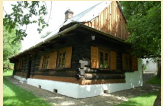
Kotulova dřevěnka