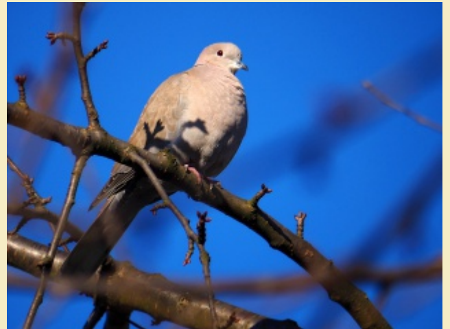
19.1. Víte, že Hrdlička zahradní se při lednovém sčítání ptáků na krmítkách umístila na Ostravsku na šestém místě? S průměrem 4,4 na hejno. Do našeho krmítka se jich slétá 12...