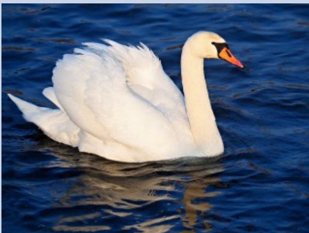
22.1. Labuť velká. Jedna z těch, které přezimovaly u nás pod mostem, na řece Ostravici.