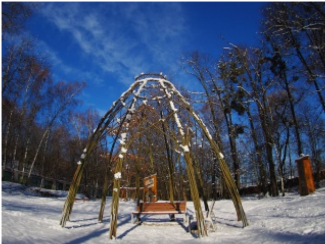
5.2. Vrbový altánek pod sněhovou peřinou, hopsající ptáci kolem krmítek a k tomu pořádná dávka slunečních paprsků, to je kouzelná zimní procházka Hrabovjankou...