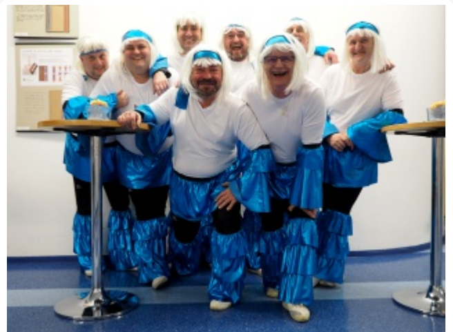
8.2. Po úsměvném vystoupení na hrabovském obecním plese, s repertoárem skupiny ABBA, nám s radostí zapíjovali Bobři - BŮlatičti BŘicháci.