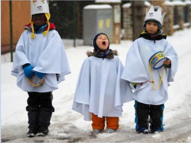
12.1. Někteří „malí králové“ si tříkrálové koledování náležitě užili ... :))