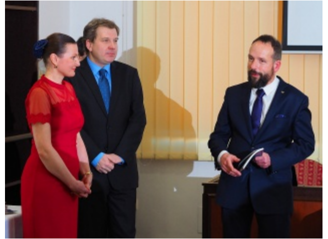
31.1. Křest „Ostravského kalendáře 2018“, kde najdete i naši Hrabovjanku a pietní altár na místním hřbitově k 30. výročí od úmrtí Jaromíra Šavrdy, významného novináře, spisovatele a signatáře Charty 77.