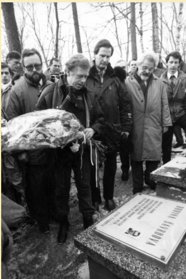
Fotografie z návštěvy československého prezidenta Václava Havla na hrabovském hřbitově 3. ledna 1990