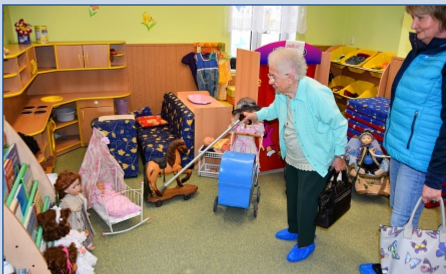
Návštěvníci Mateřské školy Klubíčko byli nadšeni, když viděli, jak dnes hrabovská školka vypadá.