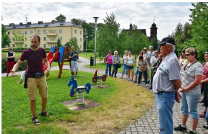
Účastníci komentované prohlídky na prostranství mezi radnicí a kostelem.

Další zastavení bylo u místní fary a na prostranství před dnešním úřadem městského obvodu se lidé dozvěděli, že zde mělo v minulosti vzniknout nové centrum Hrabové,