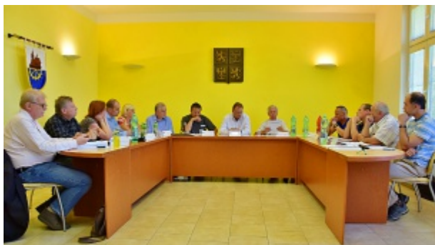
Jednání zastupitelstva 8. června 2016

Co je třeba vyzvednout? Zejména to, že náš obvod hospodaří velmi zodpovědně a příkladně bez jakýchkoliv závazků a úvěrů. To potvrzuje i Zpráva o výsledku přezkoumání hospodaření za rok 2015 zpracovaná auditorskou firmou TOP AUDITING s.r.o. Brno: „Při provádění přezkoumání hospodaření jsme nezjistili žádnou skutečnost, která by nás vedla k přesvědčení, že přezkoumávané hospodaření není ve všech významných ohledech v souladu s hledisky přezkoumání hospodaření.“