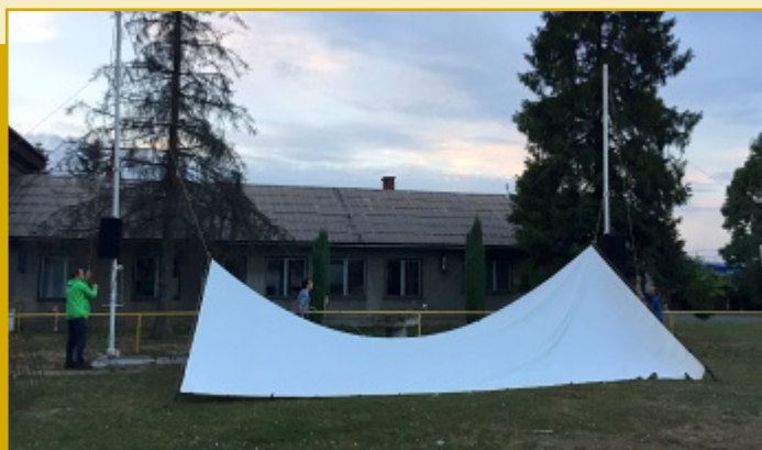
Stavba mobilního plátna při loňském kinematografu