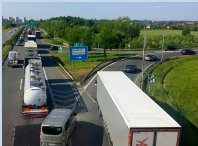
Až budoucnost ukáže, zda Prodloužená Mostní splní to, co se od ní očekává