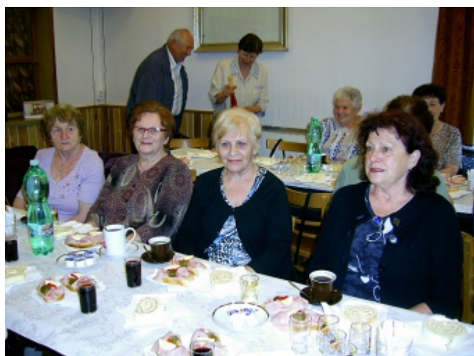
Jubilanti spolu strávili příjemné chvíle