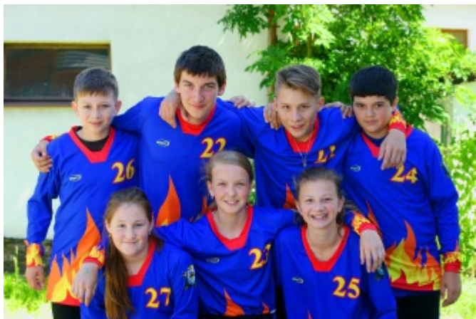
Družstvo starších žáků na závodech v Plesné 18.6.