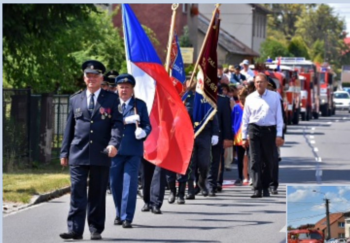
Slavnostní průvod od základní školy na hřiště