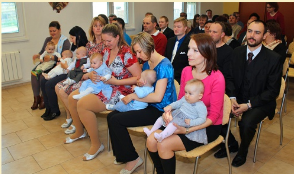
Noví občánky se svými maminkami a rodinami