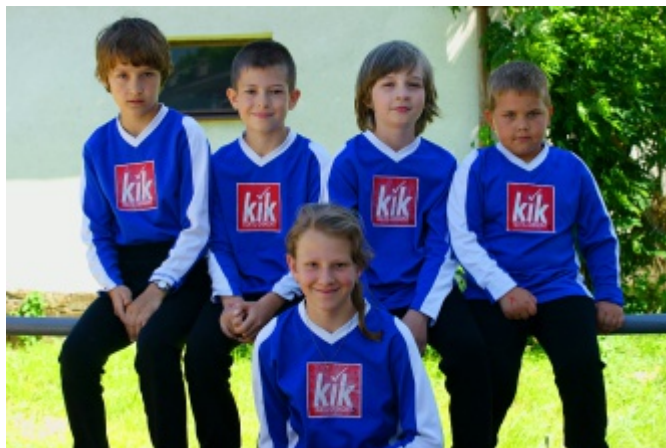
Družstvo mladších žáků na závodech v Plesné 18.6.