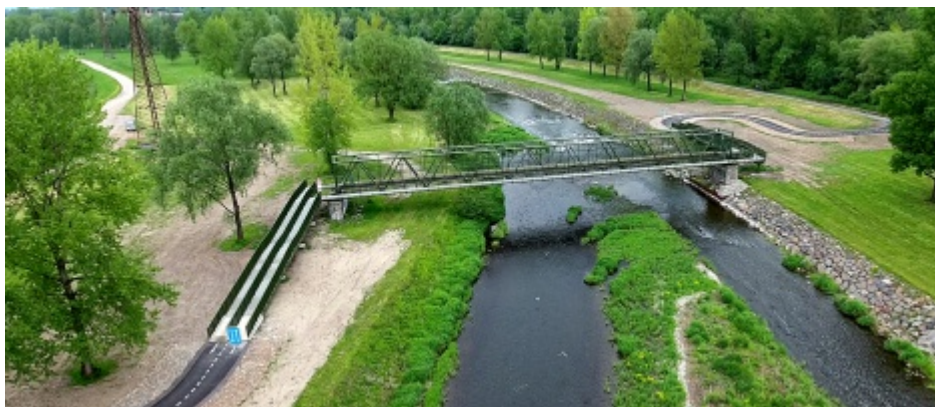
Nová lávka pro cyklisty i chodce spojující Moravu se Slezskem

Magistrát města Ostravy s pokračováním cyklostezky kolem Pilíků zatím nepočítá, protože jde o přís-