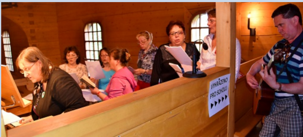
Hrabovská schola zpívající návštěvníkům Noci kostelů 2016

Celý večer až do půlnoci se v kostele střídala hudební pásma, chvíle pro rozjímání a modlitby. Zajímavá byla prezentace o umění v době Karla IV, kterou doplnila i výstava o tomto zbožném panovníkovi