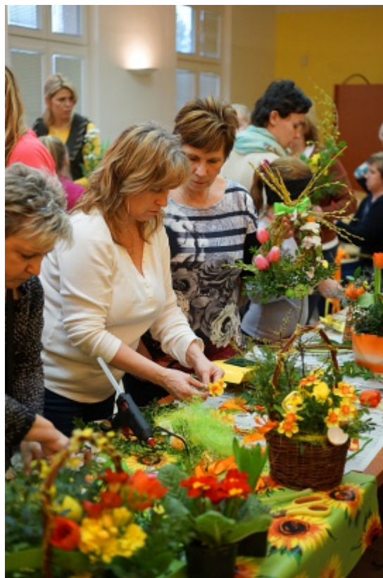
Hodně návštěvníků se zúčastnilo akce nazvané "velikonoční aranžmá", která se konala v budově úřadu.

Názory těchto čtyř zvolených představitelů obce najdete na třetí straně dnešního vydání Hrabovských listů. (pž)