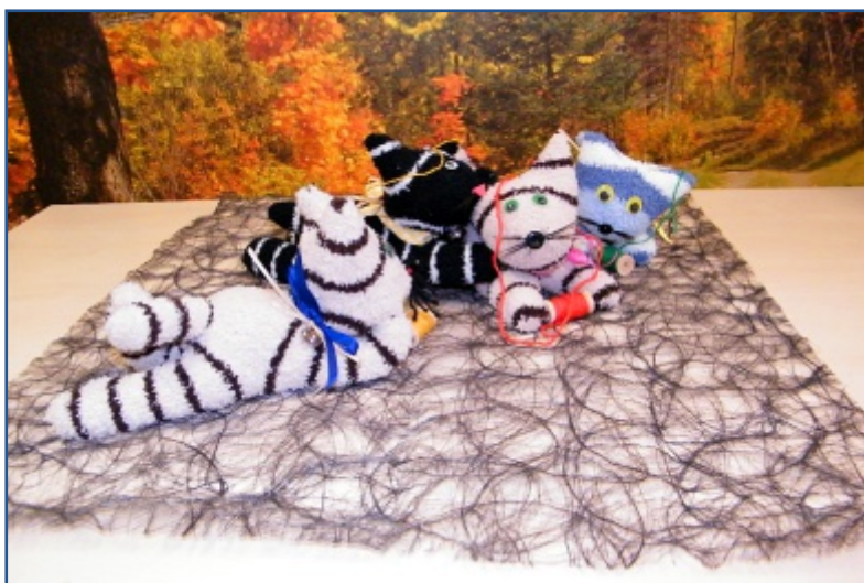
Šité kočky, jeden z mnoha podařených výtvorů našich seniorů.