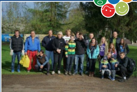
Dobrovolníci uklízeli Hrabovou dne 16.4.2016 v rámci celostátní akce „Uklid'me Česko“ 2016