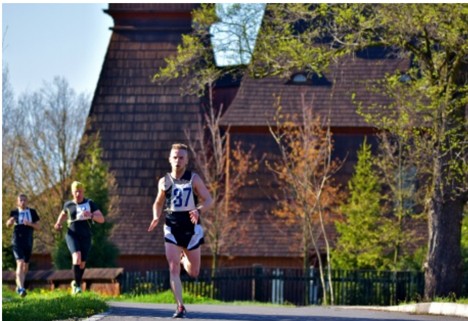
V dubnu proběhlo Hrabovou téměř osm desítek běžců dnes již tradičního Kateřinského běhu.