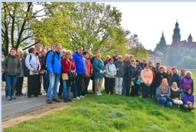
Účastníci zájezdu na nábřeží řeky Visly pod královským hradem v Krakově.

ního tábora v Osvětimi. Koncentrační tábor Osvětim – Auschwitz prošla hrabovská výprava s průvodcem. Jak autor tohoto textu zjistil, velice osobní a od srdce vedený projev průvodce, nebyl náhodný, protože jsme měli štěstí na člověka, pro kterého byl příběh Osvětimi i osobním vyprávěním o jeho rodinné historii.... Je jen málo míst, kde si člověk může uvědomit, kam vede úchylná myšlenka „o nadřazenosti“ lidské