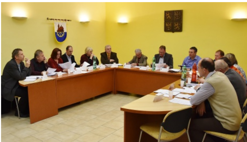
Zasedání březnového zastupitelstva

Naopak rozhodli realizovat akci „Kulturní středisko – Rekonstrukce sociálních zařízení“ a projednali zadání veřejné zakázky malého rozsahu na provedení opravy výtlačků místních komunikací U řeky, Šídlo-