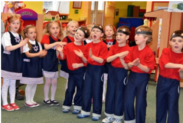
Kluci a holky z Klubíčka při koncertě pro návštěvníky