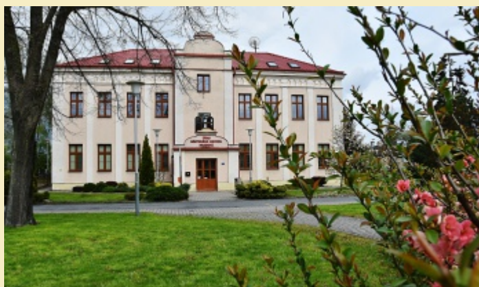
Před čtvrt stoletím moudří lidé rozhodli, že obecní blaho Hrabové by se mělo řešit v této budově.

infrastruktury, vždy by měly přednost požadavky nových sídlišť, kde bydlí nejvíce lidí. Dále pak činnost orgánů samosprávy, místních spolků a organizací. Určitě by to nebylo tak, jako dnes. Nebo místní časopis. I když se v posledních letech snesla vlna kritiky, byl vždy významným zdrojem informací. Mezi občany by byl daleko větší odklon od věcí veřejných ve srovnání s dnešním stavem.