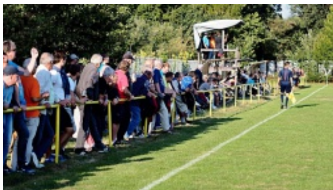
Své fotbalisty přicházejí podpořit stovky fanoušků

někdy až krutým výsledkem. To, že kluci pracují na směny, se občas projeví i na tréningu a bez přípravy to prostě nejde, tak jak má.