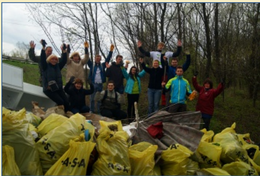
„Uklidme Česko 2015“