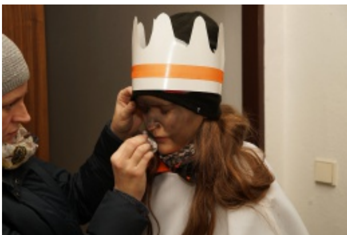
Příprava „krále Baltazara“ v plném proudu