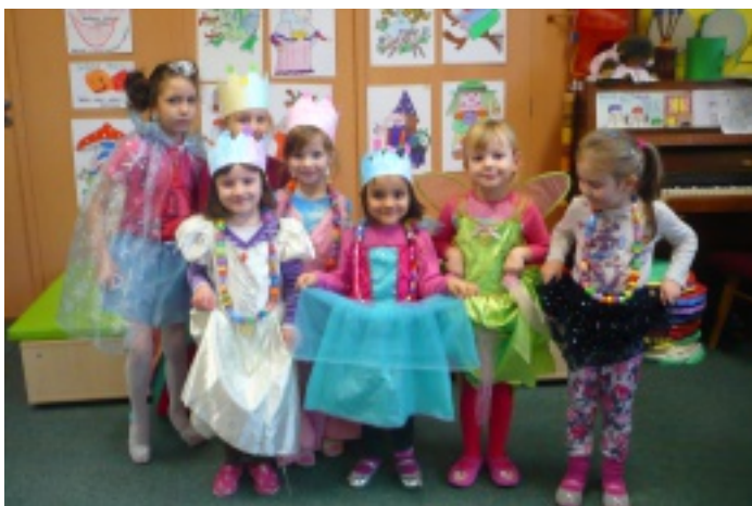
Děti z mateřské školy Klubíčko

Dny otevřených dveří nejsou jen možností zavzpomínat na první