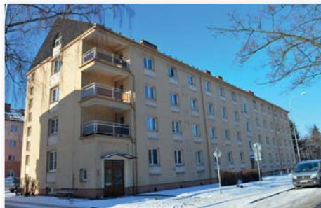
DPS na ulici Šrobárova s kapacitou 36 bytů.

Dům se zvláštním určením na ulici Šrobárova 22 se nachází v obvodu Hrabová na Šídlovci. V dřívějších dobách objekt sloužil jako ubytovna pro dělníky a brigádníky Vítkovických staveb. V roce 1998 proběhla celková rekonstrukce objektu a od té doby patří Úřadu městského obvodu Hrabová.