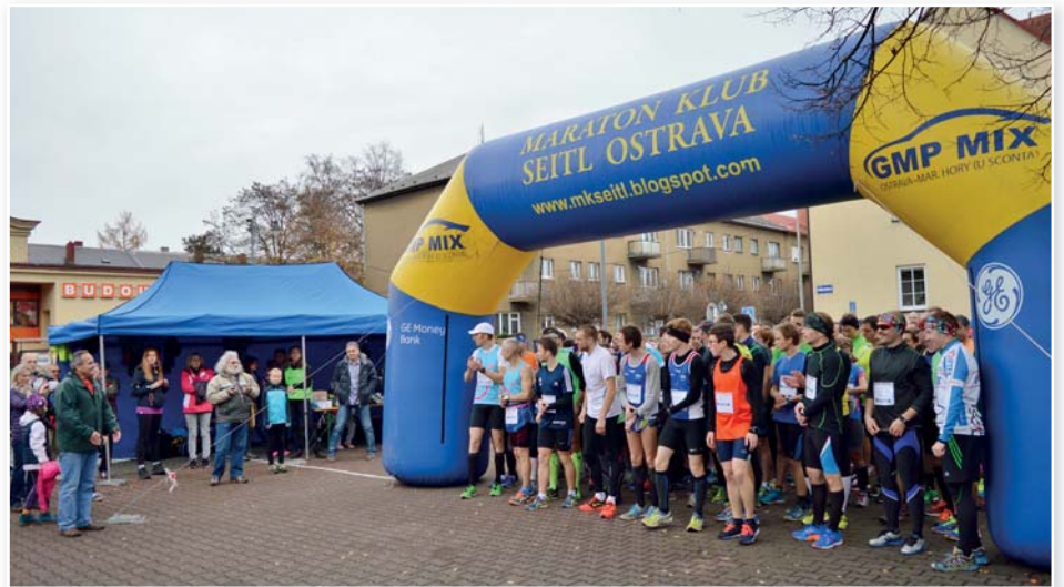
17. listopad lze připomínat různě. Proč ne během na trati, která vyžaduje odvahu a vůli?