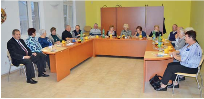
Jubilanti se příjemně pobavili.