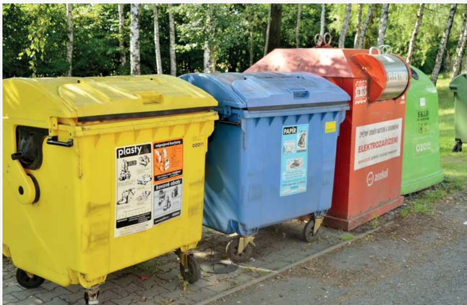
Díky patří všem, kteří správně nakládají s odpady.