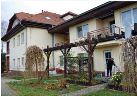
DPS na ulici Bělská poskytuje ideální, klidné prostředí k bydlení.