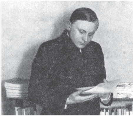
Vilém Závada, asi 1930.

Básník, překladatel, organizátor literárního života od dvacátých do sedmdesátých let XX. století se narodil 22. května 1905 v Hrabové (zemřel 30. 11. 1982 v Praze). Hrabová v době Zavadova dětství byla vesnicí, která zažívala dramatickou proměnu sousední Ostravy v dravé průmyslové město, ale zároveň ležela v podhůří Beskyd.