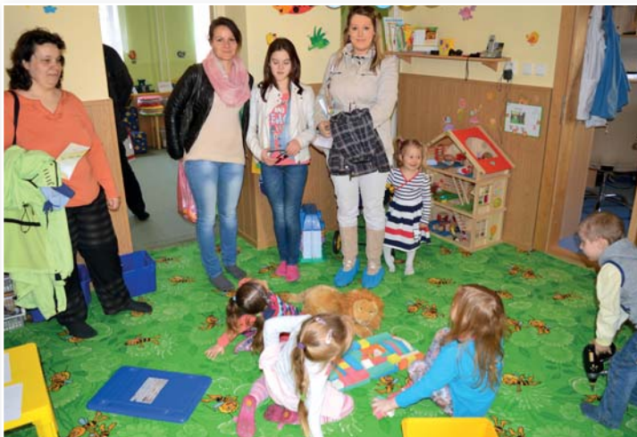
U zápisu v Klubičku.