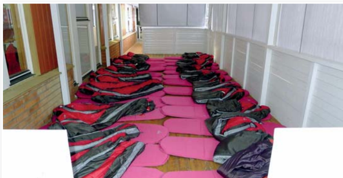
Spaní - Švédsko.

„Vzdělávací systém je v mnoha bodech stejný jako v naší republice. Přesto se odlišuje ve významných jevech. Tím, že třídy tvoří maximálně 19 dětí a pracují s nimi tři pedagogové, je zde dán obrovský prostor pro individuální přístup k dětem. Dítě je rozvíjeno dle vlastního tempa a zvláštností, převažují spontánní aktivity nad aktivitami řízenými. Dítě si neustále samo určuje, o co má zájem, a učitelka do her nezasahuje, pouze je rozvíjí a sleduje dítě. V případě, že potřebuje pomoci a poradit, je mu po ruce. Ve třídách je klidná atmosféra a pohoda dětí je pro učitelku prioritou. Učitelé nepiší žádné plány a záměry denní práce, pouze sledují rozvoj dítěte a pomáhají mu v jeho růstu. Nejsou stanoveny žádné standardy dítěte, každé dítě je osobité. Na základě toho není ve Švédsku odklad školní docházky. Je zde ve velkém deklarována rovná příležitost ke vzdělání pro všechny děti.“