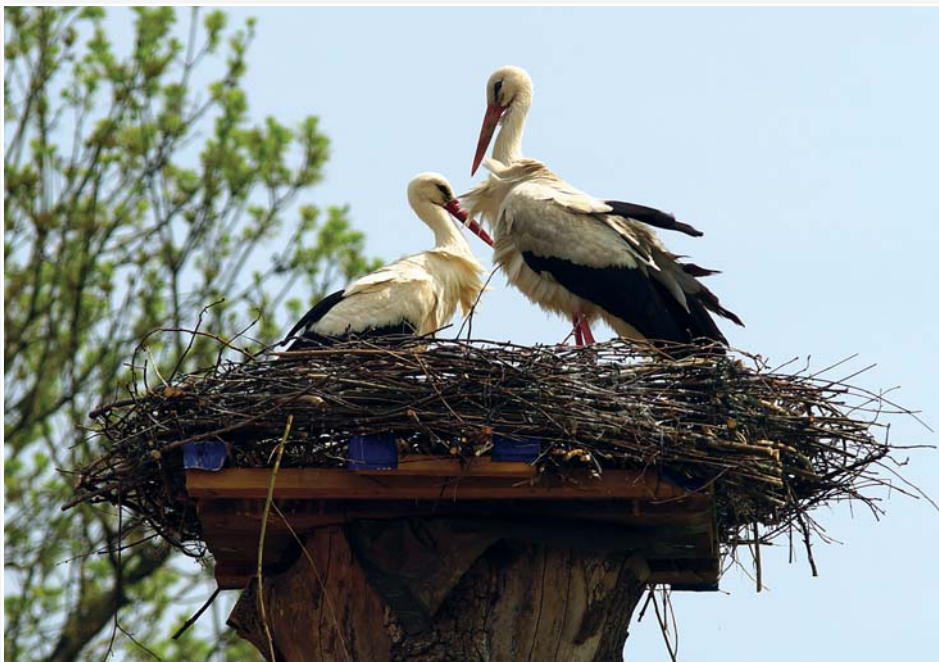
Obnovené čapí hnízdo – ozdoba obce.