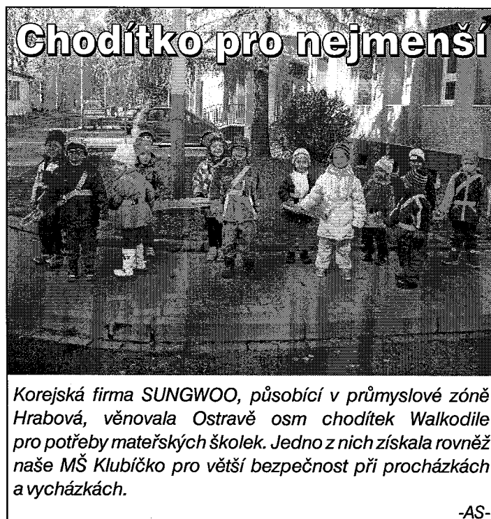
Korejská firma SUNGWO, působící v průmyslové zóně Hrabová, věnovala Ostravě osm chodítek Walkodile pro potřeby mateřských školek. Jedno z nich získala rovněž naše MŠ Klubičko pro větší bezpečnost při procházkách a vycházkách.

Jako host byla pozvána paní Taťána Kocembová, jedna z nejlepších českých běžkyň, která přiblížila přítomným svou sportovní kariéru a zklamání z olympijských her, na které nemohla jet kvůli tehdejšímu režimu.