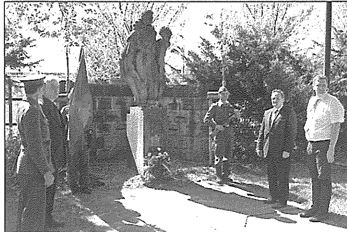
Zpestřením tradiční vzpomínky na výročí osvobození, s položením věnce u památníku obětí války na místním hřbitově, byla letos asistence přátel vojenské historie v dobových uniformách.

večer, nebude linka 27 zajižďet ani na Žižkovskou, protože zajižďení linky 27 k Hrabové Tesco bylo Magistrátem města Ostravy podmíněno tím, že nebudou navýšeny dopravní výkony oproti uzavřené smlouvě s Dopravním podnikem Ostrava a.s.