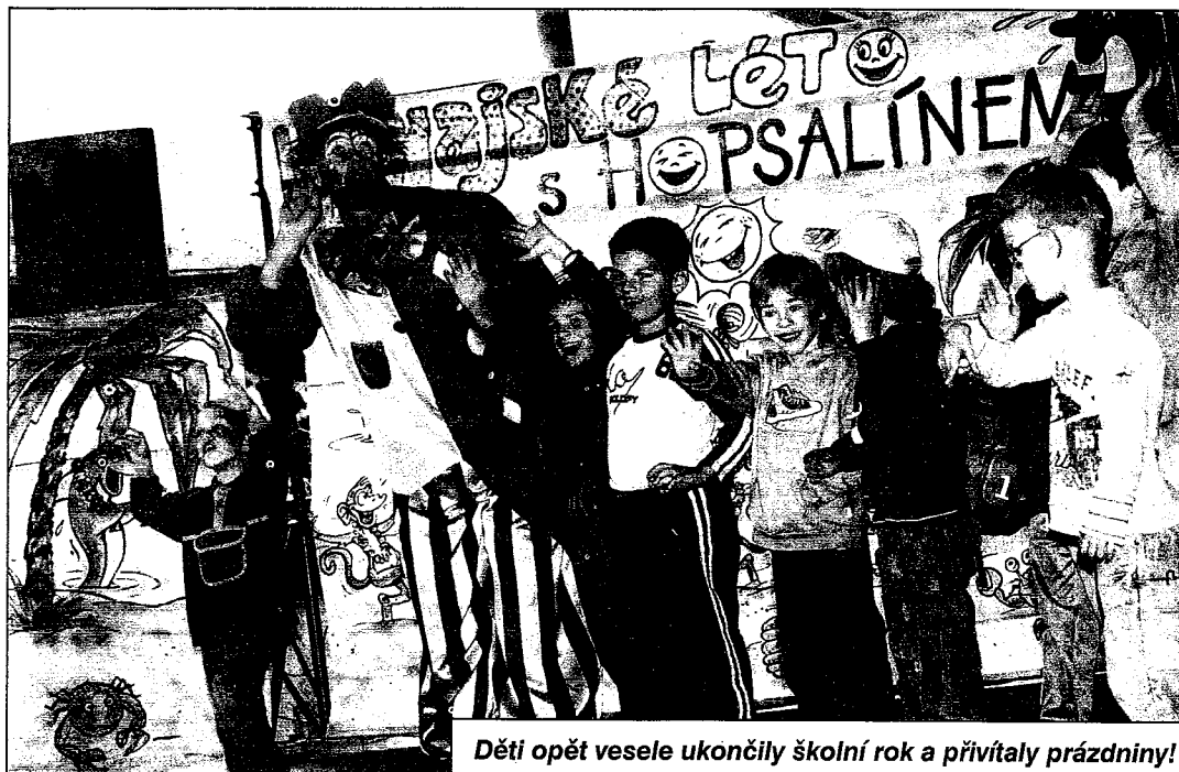
Děti opět vesele ukončily školní rok a přivítaly prázdniny!