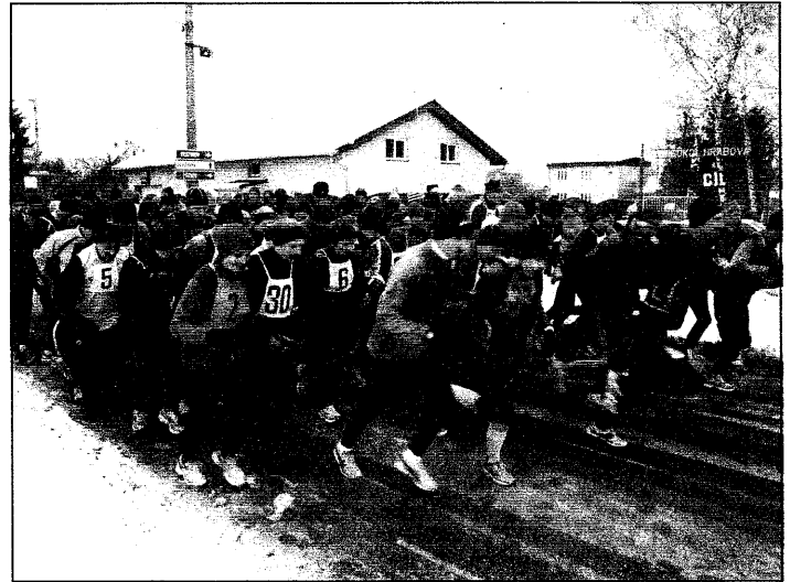
Záběry ze startu závodu u TJ Sokol na Paskovské ulici.