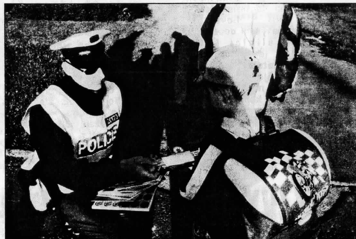
Dozor a pomoc policistů při začátku školního roku