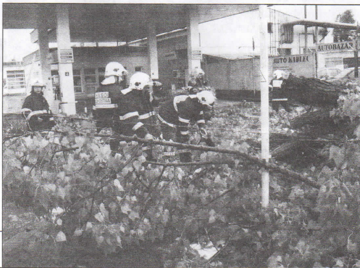
Místní hasiči odstraňují následky letní bouře u Benziny.

Kontakt Otto Seitl, tel: 737755953, 737809580 www.mkseitl.blogspot.com , mkseitl@centrum.cz