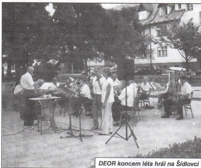
DEOR koncem léta hrál na Šídlovci

S přáními pohody a zdraví přeje vedení školy.