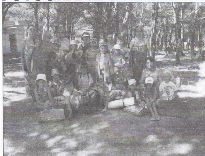
Některé hrabovské děti využily v červenci pobyt na letním táboře Baška v Chorvatsku.