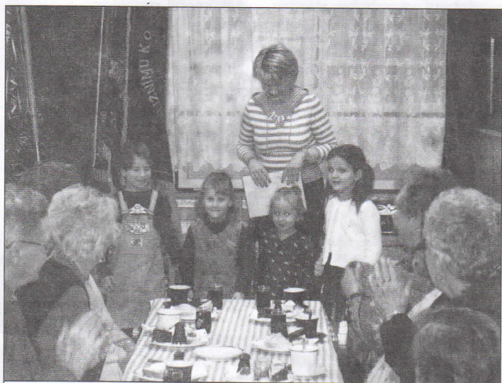
Děti z mateřské školy Příborská předaly v listopadu jubilantům Hrabové drobné dárečky