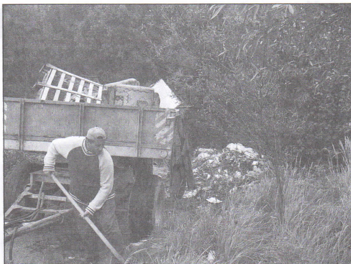
Černé skládky jsou "zlým snem" každého obvodu. Občané se nepolepší?

Den 26.září jsme oslavili netradičním způsobem. V hodinách cizích jazyků jsme zpracovávali skupinové projekty o jednotlivých evropských jazycích. Žáci se seznámili s pro ně možná i novými jazyky, ale také s kulturním prostředím jednotlivých zemí,