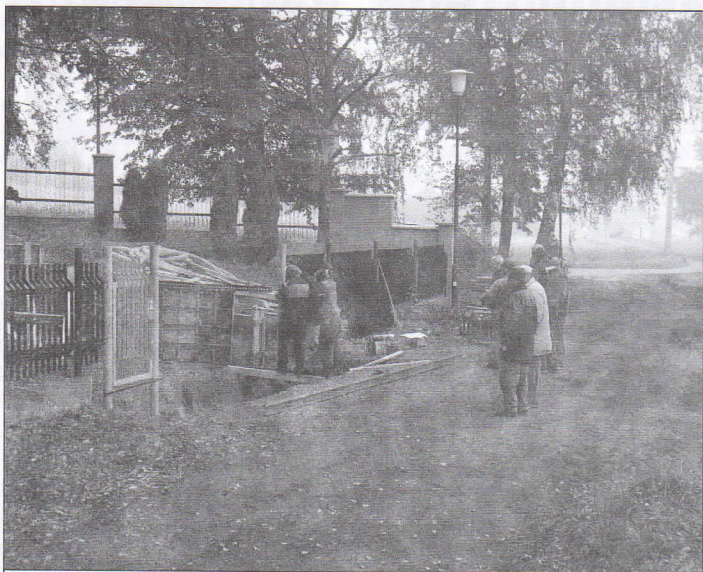
Městský obvod Hrabová vybudoval na hřbitově kontejnerové stání pro zlepšení manipulace se hřbitovním odpadem.