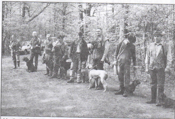
Myslivci při zkoušce vloh loveckých psů