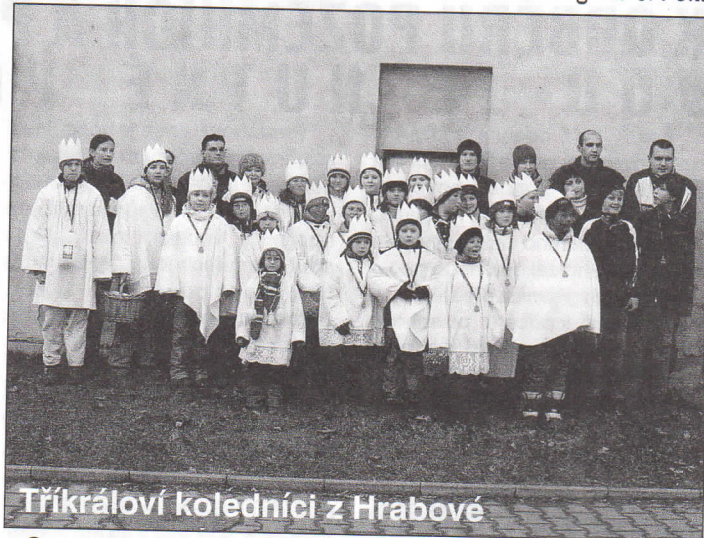
Tříkráloví koledníci z Hrabové