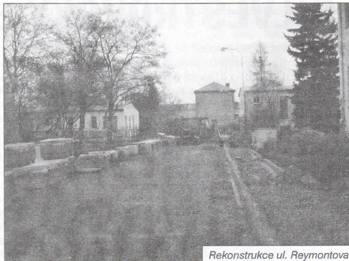
Rekonstrukce ul. Reymontova