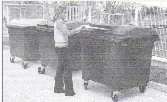
Během měsíce října byla doplněna stanoviště na separovaný sběr o sběrné nádoby na papír a na sklo. Kontejner na papír je určen k odkládání novin, časopisů, kartónů (krabice, vlnitý papír), sešitů, knih, sáčků. Do kontejnerů neukládejte papír mastný, vlhký ani jinak znečištěný!