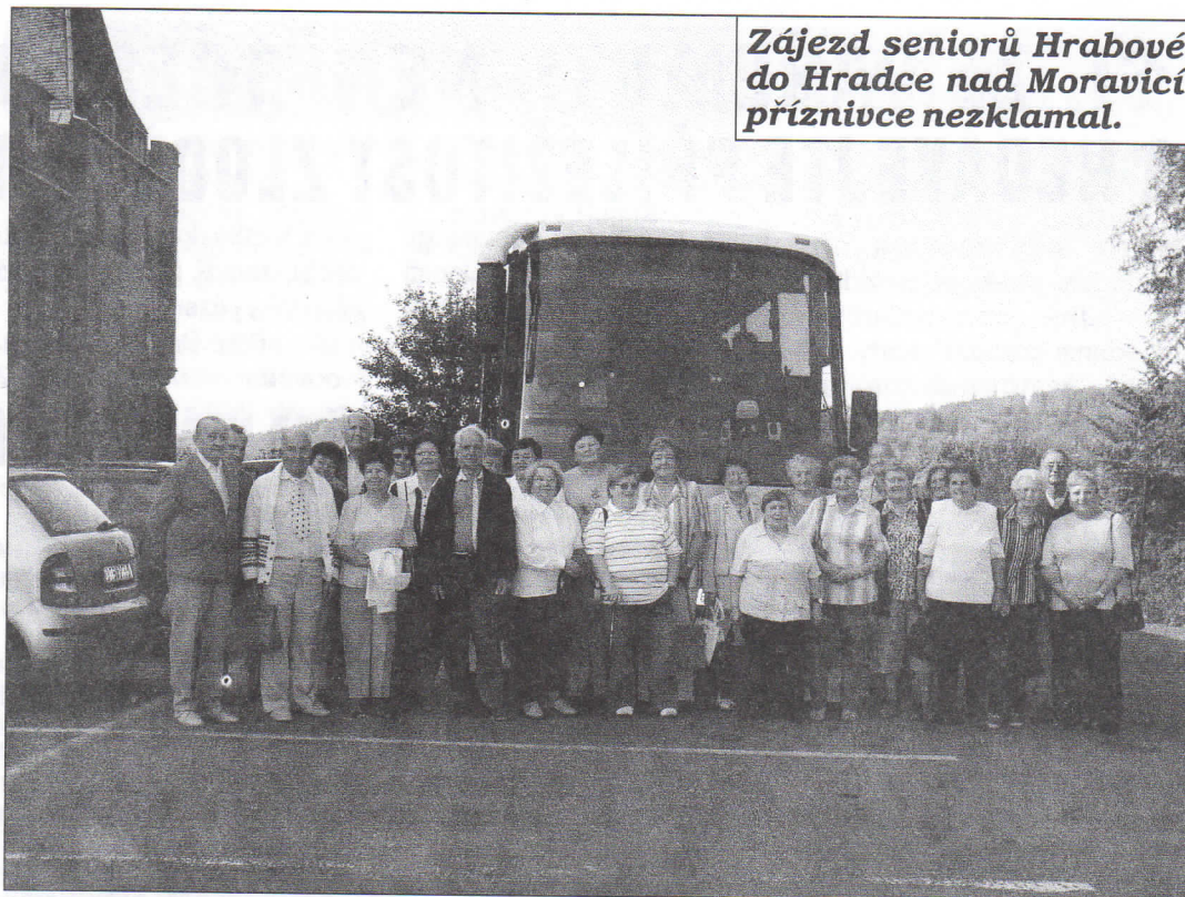
Zájezd seniorů Hrabové do Hradce nad Moravicí příznivce nezklamal.

Vážený občane, milí čtenáři, Jménem zastupitelů městského obvodu, jménem úředníků obvodního úřadu i jménem redakce přejeme vám všem k Vánocům a do Nového roku hlavně hodně zdraví, štěstí, spokojenost a dobrou životní pohodu. Ať se vám splní každé hezké a dobré přání. Vaše Hrabovské listy