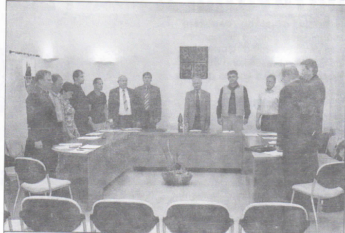
Zastupitelé hymnou zakončili své působení ve funkčním období 2002 – 2006. Nezklamali a patří jim poděkování za starost o věci veřejné v Hrabové.

Koncert se uskuteční 19.12. v 16 hodin v kostele sv. Kateřiny v Ostravě – Hrabové a stejně jako vloni jsme se jako organizátoři rozhodli dát prostor nejen dětem z naší školy, ale také ze dvou dalších škol - Pěveckému sboru při ZŠ MUDr. Emílie Lukášové a ZUŠ Viléma Petrželky v Ostravě – Hrabůvce.