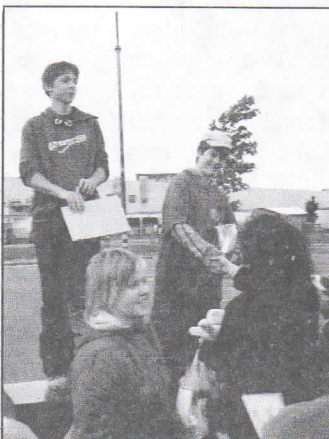
Slavnostní vyhlášení z "Hrabovského Tesco koloběhu" - blíže viz strana č. 4

prostředí pokáceno pět topolů a jedna lípa, kterou se ani přes snahu o její záchranu pomocí lanové techniky nepodařilo uchovat.