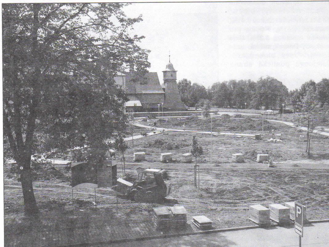
V místě mezi kostelem sv. Kateřiny a ulicí Bažanova je navržen oddechový park, klidová zóna městského obvodu - v současné době před dokončením.

Víte, že ... se v Hrabové opět usídlili čápi?