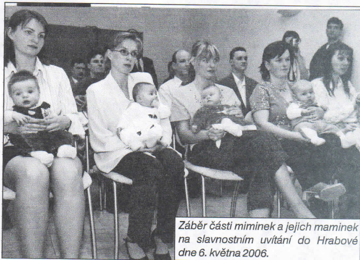
Záběr částí miminek a jejich maminek na slavnostním uvítání do Hrabové dne 6. května 2006.