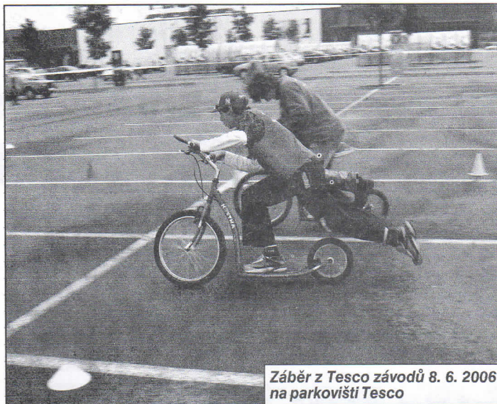
Záběr z Tesco závodů 8. 6. 2006 na parkovišti Tesco