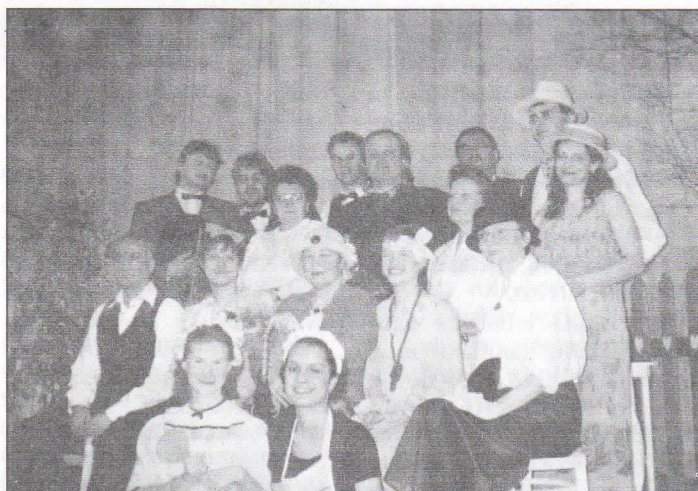
Představení: J. Štolba - "Na letním bytě"

V současné době jsme v období zkoušek na pohádku pro děti od J.Říhy „Dvě Maričky“. Chtěla bych tímto, po námi uváděných veselohrách pro dospělé, nabídnout