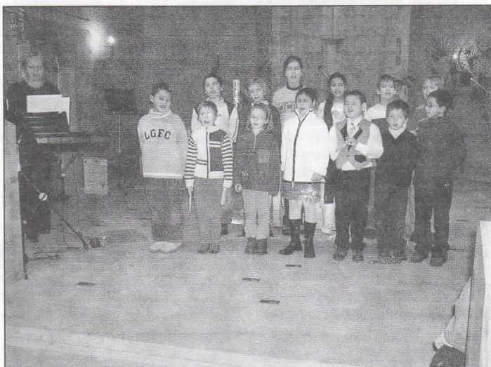
Kostel Sv. Kateřiny je místem, kde při slavnostních příležitostech vystupují pěvecké soubory. Na snímku žáci Soukromé speciální školy.