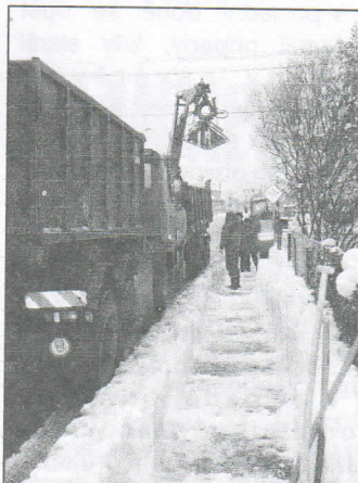
Bitva se sněhem na chodníku u Paskovské naproti podniku BETA

Rychlostní komunikace R 56 - Místecká ve vyhlášce není uvedena, nebude tedy zpoplatněna. A to je dobře, v souladu se stanoviskem Městského obvodu v Hrabové, o němž jsme vás informovali v září loňského roku.