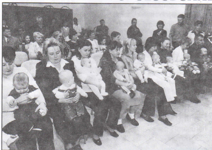
Dne 15.října 2005 proběhlo v zasedací síni Úřadu městského obvodu slavnostní uvítání dvaceti nových občanů Hrabové.