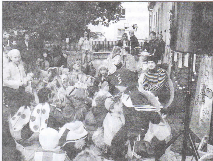
Broučkáda v MŠ se těšila obrovskému zájmu dětí

„Vánoční dílničky“. Neopomeneme již tradiční zdobení a rozsvěcování vánočního stromu v parku na ul. Příborská. Na tuto akci vás srdečně zveme, bude se konat