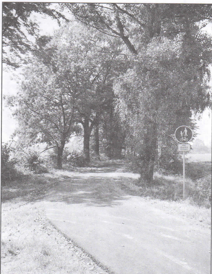
Blahopřejeme cyklistům! Novou cyklostezkou od ulice Bělské s asfaltovým povrchem si už určitě mnozí vyzkoušeli a pochvalují. Vždyť je bezpečně spojuje s Mitrovicemi a na ně navazujícími trasami buď blíž k horám nebo do krásného povodí Ondřejnice a Odry.