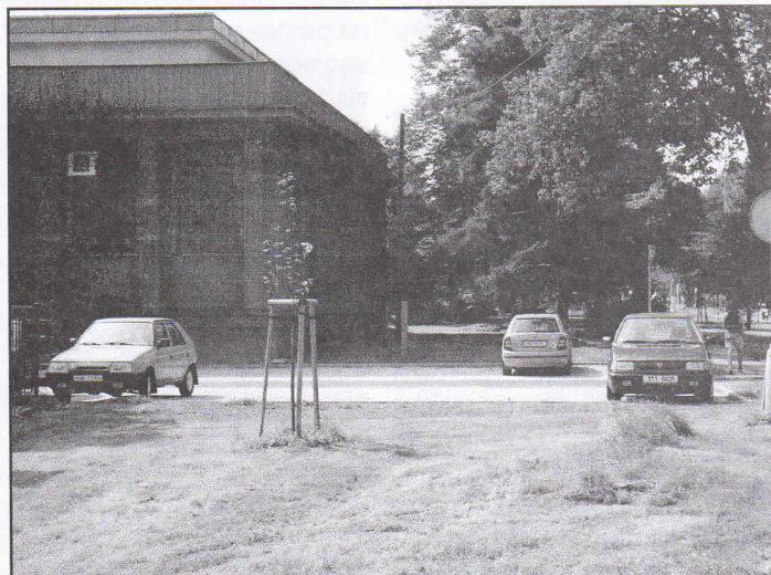
Úřad městského obvodu se stará o rekonstrukce a úpravy komunikací a veřejných prostranství. Svědčí o tom i nově vybudované parkoviště u základní školy.

Do kontejnerů na nebezpečný odpad si připravte autobaterie, zářivková tělesa, oleje, kyseliny, zásady, plechovky od barev, drobný chemický odpad apod.