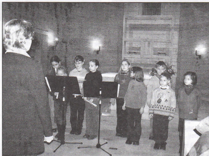
Foto z prvního koncertu hudebního kroužku žáků naší ZŠ v obnoveném kostele sv. Kateřiny

Do těchto kontejnerů lze umístit autobaterie, zářivková tělesa, oleje, kyseliny, zásady, plechovky