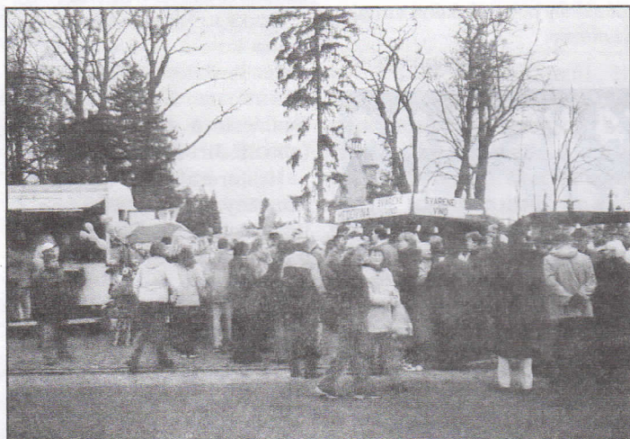
Žihadlo, svařák, turecký med stejně jako jelita, ovar, různé sladkosti a další laskominy - to je součást i naší Kateřinské pouti, z níž je náš záběr.