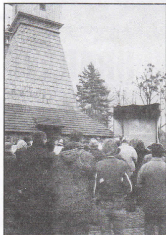
Vysvěcení kostela biskupem mnoho lidí (kteří se nevešli do kostela) sledovalo na obrazovce