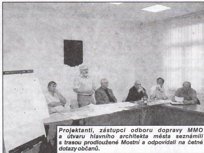
Projektanti, zástupci odboru dopravy MMO a útvaru hlavního architekta města seznámili s trasou prodloužené Mostní a odpovídali na četné dotazy občanů.

Obě stanoviska rady byla potvrzena v jednání zastupitelstva.