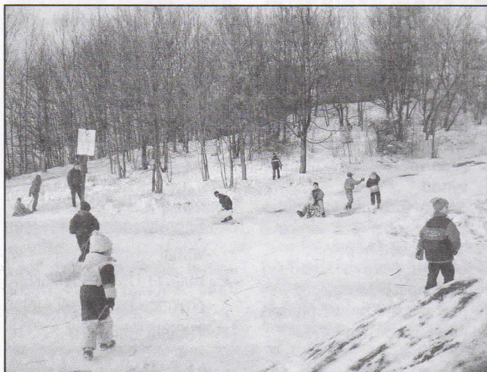
Výskot, smích a křik provází radost dětí na sněhové nádílce a podmalovává zimní náladu také na haldě u Šídlovce. Rodiče, dejte pozor na své ratolesti!